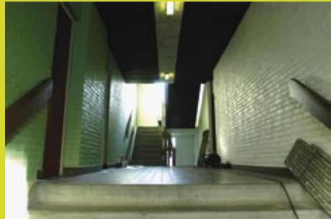
De trapportalen krijgen een (lichter) kleurtje.